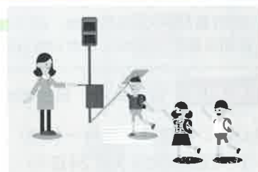
地域でのパトロール