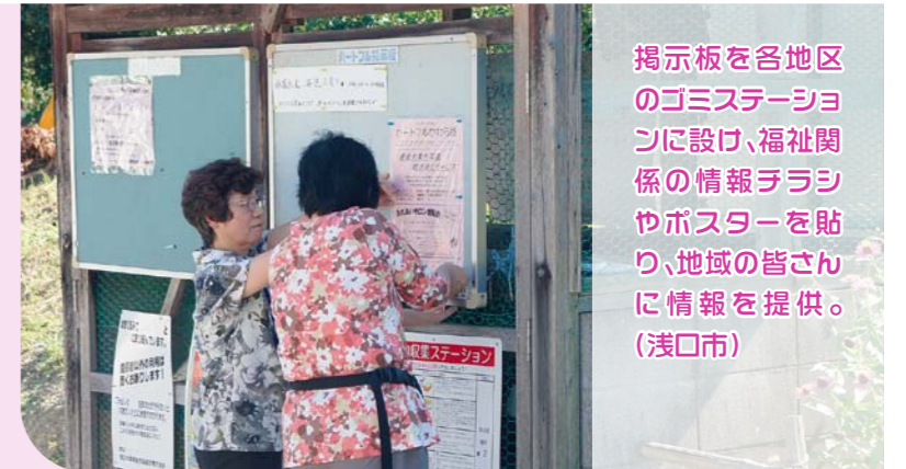
掲示板を各地区のゴミステーションに設け、福祉関係の情報チラシやポスターを貼り、地域の皆さんに情報を提供。(浅口市)

住民に必要な福祉に関する情報を広めることも一つの役割です。広報誌や届け物などをポストに入れるだけでなく、直接顔を合わせて伝える事で安否確認も兼ねています。何か困ったら気軽に相談できるという安心感にもつながります。