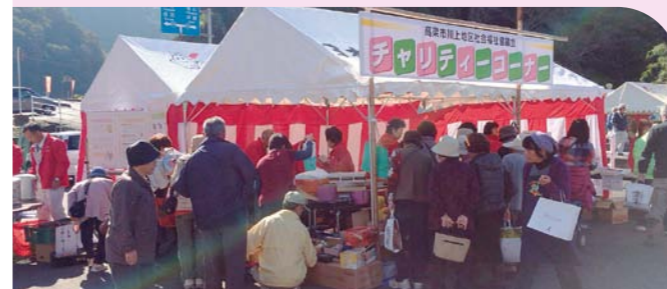
地区の行事を活用した福祉啓発活動。(高梁市)