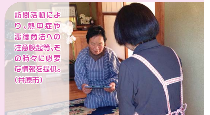
訪問活動により、熱中症や悪徳商法への注意喚起等、その時々に必要な情報を提供。(井原市)