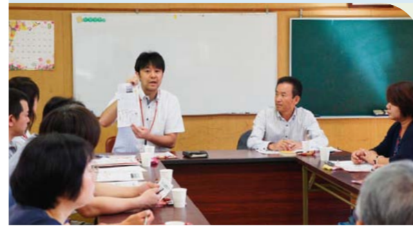
住民と専門職の方々が、団地に住んでいる住民の問題や困っている事を情報共有し、支援の方法を考える団地ケア会議を開催。(総社市)