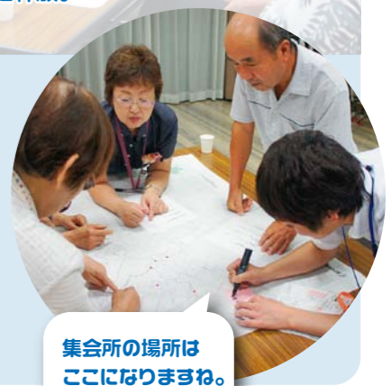
集会所の場所はここになりますね。