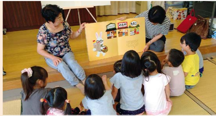
地域全体で子育てをして行ける様、親と関係団体、福祉委員が企画・運営している親子サロン。(笠岡市)

日頃から地域のサロンなどの地区行事に参加し、普段から地域とのつながりを持つておくことも大切な役割です。地域に出ていくことで、地域の情報や実情なども良く分かるようになり、福祉委員自身も自然と地域住民とのつながりができてきます。