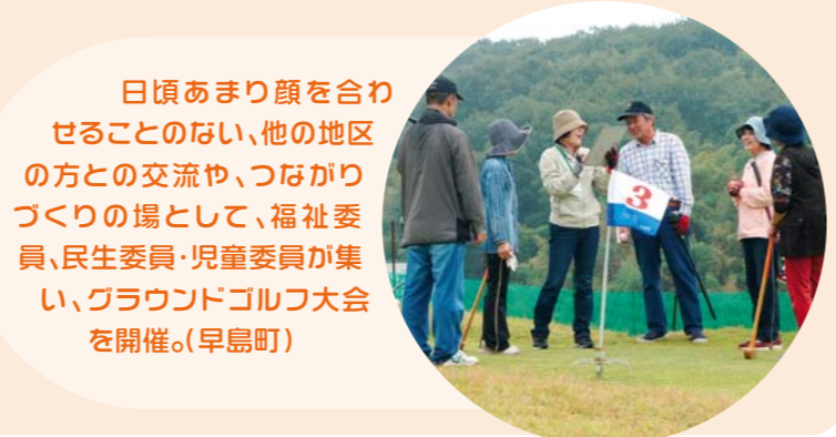
日頃あまり顔を合わせる事のない、他の地区の方との交流や、つながりづくりの場として、福祉委員、民生委員・児童委員が集い、グラウンドゴルフ大会を開催。(早島町)