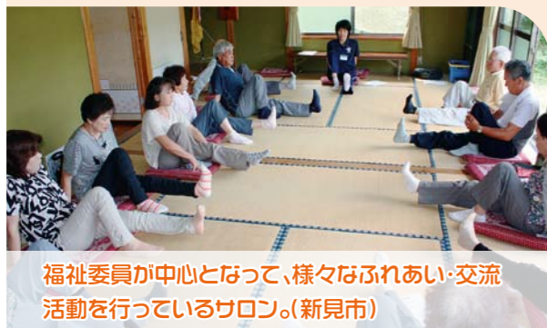
福祉委員が中心となって、様々なふれあい・交流活動を行っているサロン。(新見市)