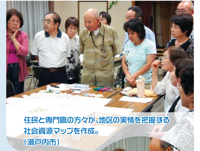
住民と専門職の方々が、地区の実情を把握する社会資源マップを作成。(瀬戸内市)

住民からの相談や日頃の見守りや声かけにより、気になることに気付いたり発見した際は、ひとりで抱え込まず、民生委員・児童委員や社会福祉協議会、地域包括支援センター等の関係機関へ知らせることも一つの役割です。専門職と定期的に情報交換の場を持つことで、信頼関係も構築されます。