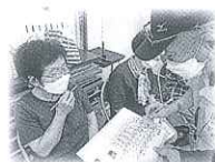
サロン西村とひまわり