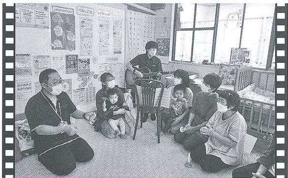
日生 うみっこ丸の多世代交流会

今年もうみの家の皆さんより、手作りのぞうきんをご寄付いただきました。ひとつひとつ心を込めて作ってくださったぞうきんは、あたたかいメッセージと共に、市内で必要とされている施設や団体にお渡しさせていただきます。（9月25日/うみの家）