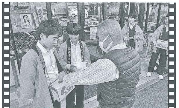
日生 街頭募金活動

吉永文化祭に中学生ボランティア（三石中5名・吉永中6名）が参加しました。募金の呼びかけやポップコーン・綿菓子の提供をして、たくさんの方にご協力いただきました。中学生は「地域の人と関わることができて楽しかった」と普段とは違う人との関わりを喜んでいました。（10月29日/吉永地域公民館）