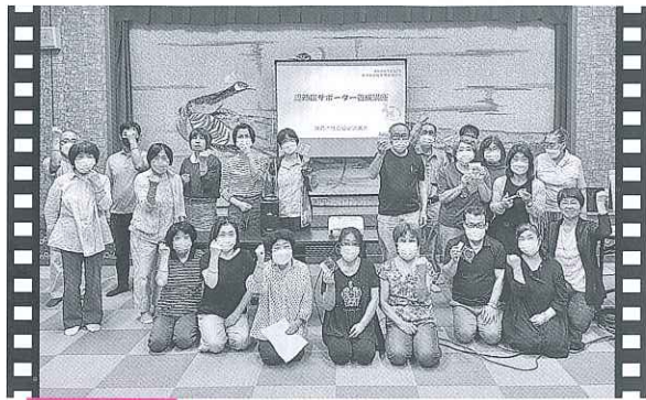
寒河 認知症サポーター養成講座

寒河地区社協のスタッフ18名が同講座を受講しました。認知症サポーターとは、認知症について正しく理解し、認知症の人や家族を温かい目で見守る「応援者」です。受講者からは「認知症の症状がよくわかった」「対応するときは優しく声掛けするように心がけたい」といった声がかげられました。（9月22日/寒河コミュニティセンター）