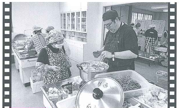
吉永 ちゃんこ鍋の振る舞い

親子がほっと一息つける居場所として運営されている「うみっこ丸」では、毎月様々なイベントが企画されています。今回は本会職員が講師として招かれ、社協の事業紹介をさせていただきました。その後は、本会の貸出しレクリエーション用品などで参加者たちと楽しい時間を過ごしました。（10月5日/うみっこ丸）