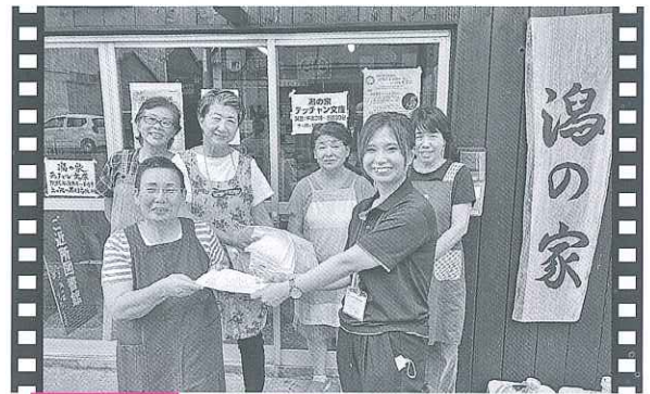
片上 ぞうきん受け取りました!

寒河地区社協のスタッフ18名が同講座を受講しました。認知症サポーターとは、認知症について正しく理解し、認知症の人や家族を温かい目で見守る「応援者」です。受講者からは「認知症の症状がよくわかった」「対応するときは優しく声掛けするように心がけたい」といった声がかげられました。（9月22日/寒河コミュニティセンター）