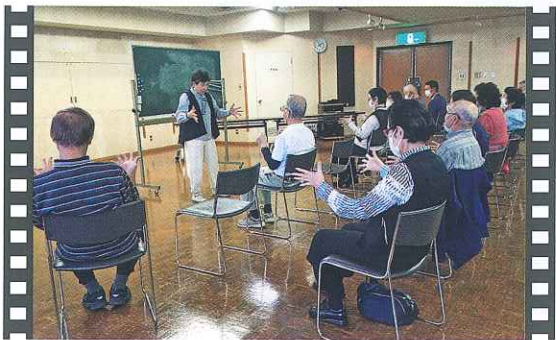
通いの場リーダー研修会

今年も6名の中学生ボランティア(吉永3名・三石3名)と街頭募金運動をしました。いろいろな人と関わることが温かい心に触れることが、良い経験になったと思います。募金運動にご協力くださった皆さま、ありがとうございました。(10月27日/吉永地域公民館)