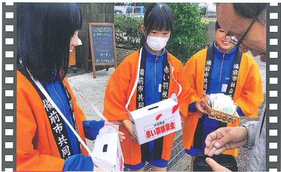
吉永 吉永文化祭 街頭募金

日生中学校の生徒が赤い羽根共同募金の街頭活動をパオーネ日生店で10月8日、17日の2日間行いました。生徒たちの「共同募金にご協力よろしくお願いします」の呼びかけに、多くの方々が募金に協力してくださいました。街頭募金にご協力いただいた皆様ありがとうございました。(写真は10月8日の様子/パオーネ日生店)