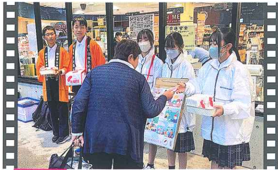
日生 街頭募金活動

子育てひろば「うみっこ丸」の多世代交流イベントに本会の職員がゲストとして招かれました。イベントでは、共同募金に関するクイズを行い、募金の目的や使い道について正しく知っていただきました。また、本会で貸し出しているハンドベルやわなげを使って参加者同士の交流を深め、大人も子どもも楽しい時間を過ごしました。(10月3日/うみっこ丸)