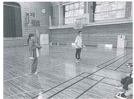
9月24日(火) ブラインドテニスの様子